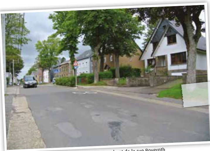
la deuxième phase du projet débute en haut de la rue Boveroth

Le projet entre à présent dans sa phase 2 : l'aménagement depuis le haut de la rue Boveroth jusqu'au bout de la rue de la Station. Dans la continuité du Plan Mercure, cette fois c'est le Plan Trottoirs qui sera sollicité. Ici, le subside est de maximum 150.000 euros. Le reste des aménagements sera directement financé par la commune, pour un budget total de 300.000 euros environ.