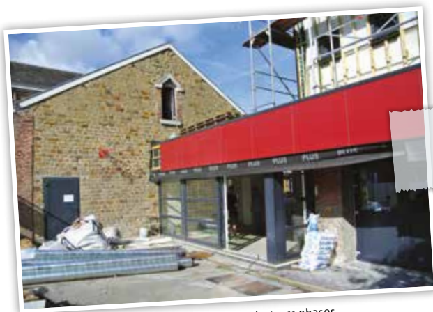
un projet réalisé en plusieurs phases

Contrairement aux premières estimations, les travaux ne seront pas complètement achevés pour la rentrée 2014. Si les plus jeunes pourront bien réintégrer les classes du rez-de-chaussée, les plus grands (5ème et 6ème primaire) feront leur rentrée à Baelen et réintégreront l'école de Membach au début du mois de novembre pour permettre le déménagement pendant le congé d'Automne. Au total, les travaux auront duré plus ou moins 7 mois, pour un montant total de 650.000 euros à charge communale. Un subside de 82.500 euros a été accordé par l'AWB pour la chaudière comme Programme Prioritaire.