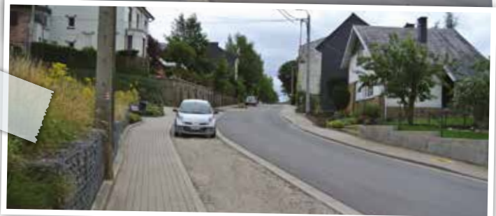
les aménagements de 2010