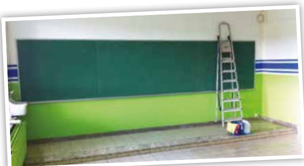
les classes du rez-de-chaussée, rénovées par l'équipe de voirie

Les classes existantes, au rez-de-chaussée, ont été réhabilitées par les ouvriers communaux : déplacement des radiateurs, aménagements, peintures ont été pris en charge par l'équipe de voirie, accompagnée durant les 15 premiers jours de juillet par les jeunes d'Été Solidaire. Les ouvriers se chargeront également de réaménager les classes juste avant la rentrée.