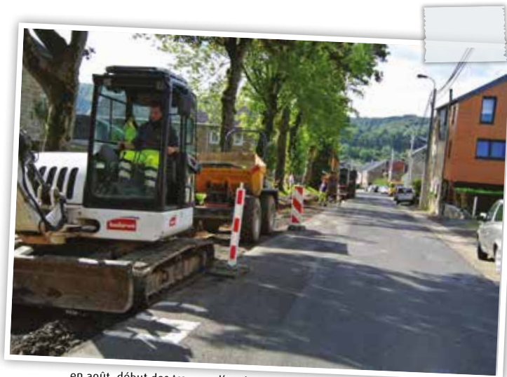
en août, début des travaux d'aménagement des trottoirs

La commune espère ainsi favoriser la convivialité au sein du village de Membach. Mais les aménagements ne suffisent pas : votre collaboration est également nécessaire. En voiture, que vous soyez habitant de Membach ou que vous traversiez simplement le village, veillez à respecter les limitations de vitesse et à vous garer exclusivement sur les emplacements de parking. Pensez aux enfants en chemin pour l'école, aux promeneurs, aux personnes âgées, montrez-vous courtois. En effet, outre l'insécurité objective (statistiques d'accidents, mesure de la vitesse des voitures qui traversent le centre), le sentiment d'insécurité vient aussi du manque de convivialité entre les usagers. Il suffit de quelques gestes simples pour que tout cela change. Les piétons sont également concernés : lors de vos déplacements à pied, empruntez les trottoirs, tenez vos animaux en laisse, et dans tous les cas, évitez de laisser derrière vous des traces de votre passage. Des poubelles publiques sont disposées dans le centre, n'hésitez pas à les utiliser pour jeter vos canettes et autres petits déchets. Sachez aussi que le ramassage des déjections de votre chien est obligatoire et qu'il est interdit de laisser un chien errer seul sur la voie publique.