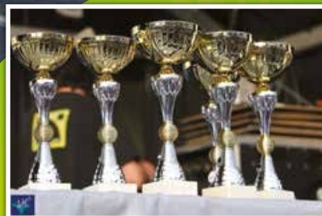
Baelen au Trophée des communes sportives