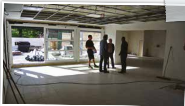
un nouvel espace polyvalent et un réfectoire agrandi

Parallèlement aux travaux d'aménagement de voirie, un autre grand projet est en cours de réalisation : l'agrandissement et la modernisation de l'école de Membach. Pour assurer un bon accueil de la population toujours grandissante de l'école communale, la commune a opté pour un agrandissement en hauteur, en ajoutant un étage au bâtiment existant. Le nombre de classes est ainsi doublé et l'ensemble du bâtiment modernisé : installation d'une isolation plus performante, de nouveaux châssis, d'un bardage en bois d'un côté et en ardoises de l'autre, remplacement de la chaudière à mazout par une chaudière à pellets, installation d'une nouvelle cuisine pour le réfectoire. Tous ces travaux permettront aux enfants de travailler dans les meilleures conditions et à la commune de réaliser de substantielles économies d'énergie. Le préau, désormais muni de grandes baies vitrées, est devenu un espace polyvalent ; le réfectoire, débarrassé du sas d'entrée, est plus grand et plus fonctionnel.