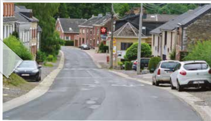
la rue Boveroth avant travaux

La commune s'est engagée dans le projet Mercure en 2007. Un auteur de projet a été désigné afin de proposer des aménagements permettant de trouver des solutions aux problèmes diagnostiqués tout en conservant les spécificités et le caractère rural de la zone. Trois grands axes ont été dégagés pour définir les aménagements à effectuer :