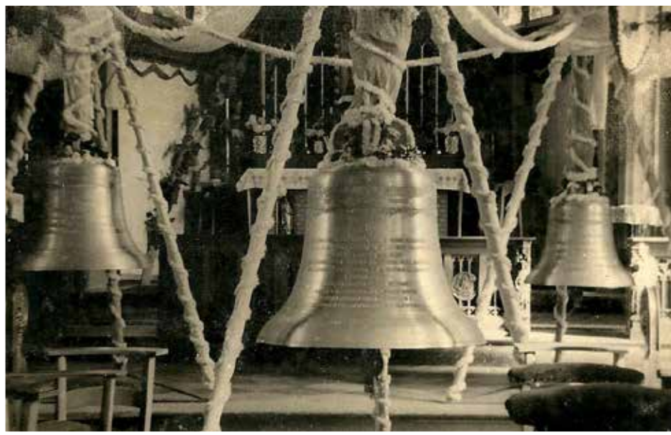
Bénédiction en l'église de Baelen en 1954