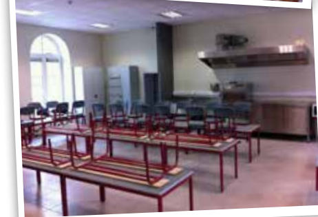
les derniers travaux de finition avant la rentrée. Depuis, tout le monde a retrouvé sa classe !