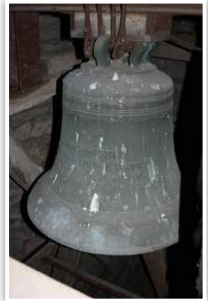
Cloche dédiée à la Vierge