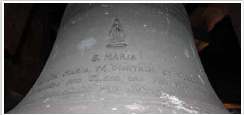
Cloche dédiée à saint Joseph

En 1942 disparaissaient les cloches de l'église de Baelen, comme tant d'autres d'ailleurs, réquisitionnées par le régime nazi. Seule une cloche destinée à sonner les heures restait en place. Après les hostilités commencent alors les reconstructions et réparations financées par les dommages de guerre. Les paroissiens devront attendre l'année 1954 pour, à nouveau, entendre le son de trois nouvelles cloches suspendues dans la tour.