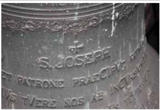
Cloche dédiée à saint Jean-Baptiste