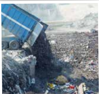
les déchets à destination du centre d'enfouissement technique sont ceux qui coûtent le plus cher

Le recyclage permet de considérables économies d'énergie et de matières premières. En outre, il évite de consommer de l'énergie supplémentaire pour détruire ce qui peut être réutilisé ! C'est également devenu une activité économique à part entière, générant des milliers d'emplois et mettant en œuvre des technologies de pointe.