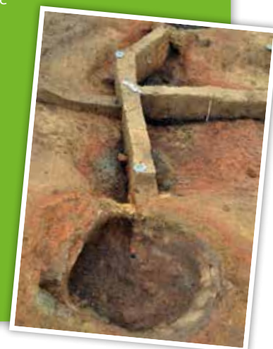
bas fourneaux jumelés en cours de fouilles à Baelen

Un parc industriel est une zone géographique exclusivement dédiée à l'installation d'industries ou d'entreprises. Outre l'aspect environnemental, cela permet de concentrer les infrastructures dans un secteur limité et donc de réduire les coûts. Historiquement, ce type de regroupement sur un site géographique est très ancien : les études archéologiques menées sur les villes de l'antiquité montrent déjà un regroupement fréquent des activités comme la poterie ou le travail du métal. A ce sujet, il est intéressant de remarquer que les fouilles archéologiques menées sur le site de l'East Belgium Park ont permis de découvrir une importante activité de traitement du minerai de fer datant de l'époque romaine. L'activité économique de la zone ne date donc pas d'hier ! Ces racines anciennes ont inspiré les noms donnés aux nouvelles rues de l'extension baelenoise : rue du Minerai, rue des Bas Fourneaux, rue des Francs.