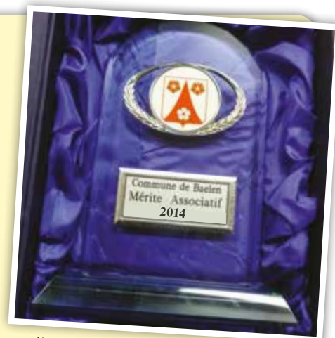
Venez soutenir vos candidats aux Mérites 2014

La soirée de remise des « Mérites 2014 » aura lieu le vendredi 20 février 2015, à 20h, dans la salle du conseil au 2 ème étage de la maison communale. Vous y êtes toutes et tous conviés pour donner votre voix, soutenir les nominés et prendre ensemble le verre de l'amitié.