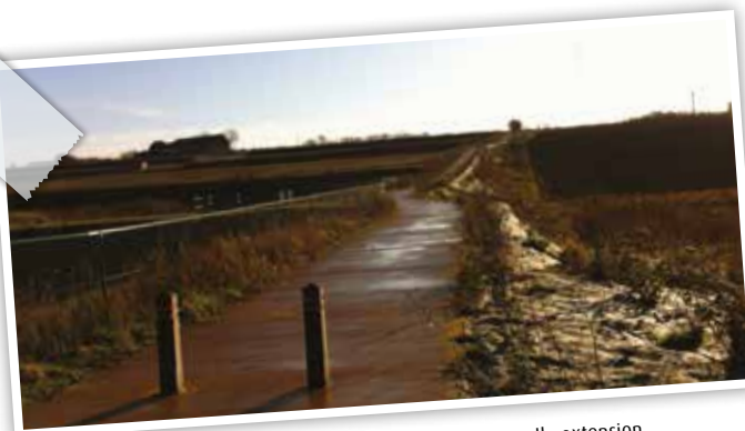
Le cheminement piéton de Nereth vers la nouvelle extension