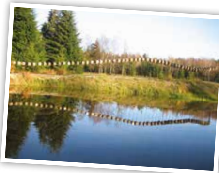
L'arboretum et le Chêne du Rendez-vous resteront accessibles à pied par le chemin forestier. En voiture par contre, on ne pourra plus y accéder que par le haut.

En attendant la décision du ministre concerné et le déblocage du budget pour effectuer les réparations, nous ne pouvons que vous recommander la plus grande prudence lorsque vous empruntez cette route.