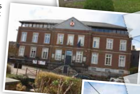
Diverses habitations de la rue de la Régence, parmi lesquelles la Maison communale.