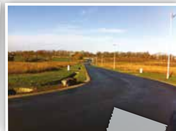
l'extension aménagée sur le territoire de Baelen et les nouveaux accès au zoning