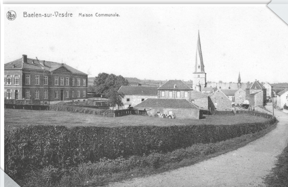
La rue de la Régence, vers 1950-1960 (?)