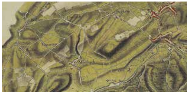
Carte de Soupire, 1761.