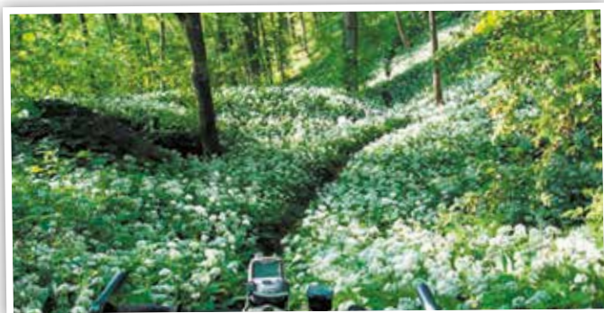
Le sous-bois au printemps

Un énorme réseau de sentiers a été développé dans tout l'est de la Belgique pour le plus grand plaisir des amateurs de vélo. Le réseau Velotour compte plus de 850 km de routes balisées selon un ingénieux système de points-noeuds qui permettent de sélectionner son itinéraire en fonction de ses capacités. De belles étapes sont proposées dans l'Hertogenwald, pour une sortie sportive ou plus familiale à vélo. Pour plus d'info : www.eastbelgium.com .