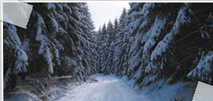
Belle en toute saison

L'Hertogenwald recouvre deux tiers du territoire de la commune. Au total, 78% du territoire communal sont constitués de forêts, ce qui fait de Baelen la troisième commune la plus boisée de Belgique. La forêt des Ducs est magnifique en toute saison, mais le printemps invite tout particulièrement à la promenade. Que ce soit pour une balade à pied, un tour à vélo ou une randonnée plus longue, vous trouverez ici quelques idées pour une sortie au grand air. Mais l'Hertogenwald ne se résume pas à ses sentiers de promenade : c'est aussi un lieu historique important et un centre d'observation scientifique de la faune et de la flore.