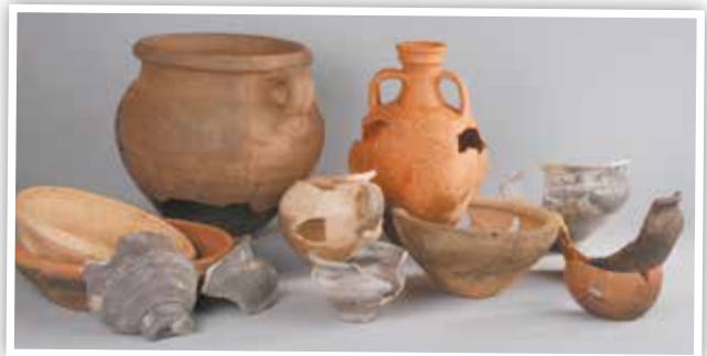
Ensemble de céramiques issu des fouilles de l'habitat germanique de Nereth-Baelen.