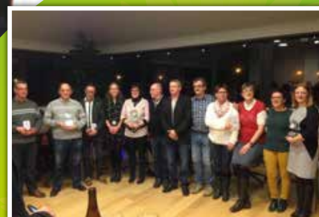
Mérites 2014 : les lauréats