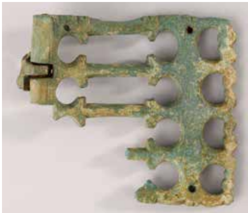
Plaque-boucle en bronze avec décoration ajourée.