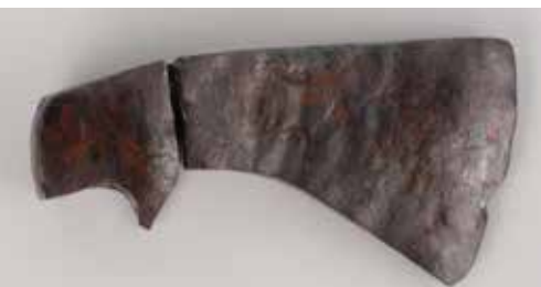
Hache de guerre en fer proto-francisque.