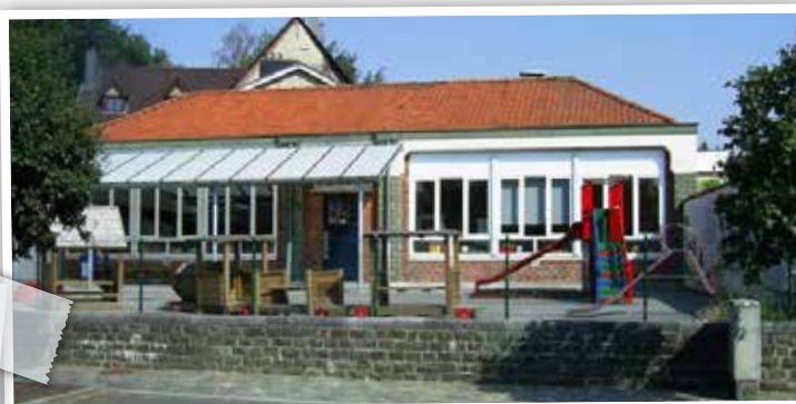
L'école maternelle de Membach dispose d'une nouvelle chaudière à condensation

Il reste deux bâtiments chauffés au mazout dont l'un (l'école maternelle de Membach) vient de voir sa chaudière remplacée par une chaudière à condensation. D'après les premiers calculs, la consommation est divisée par deux pour cette école.