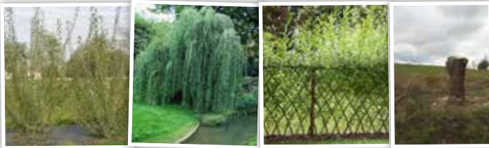
Saule pourpre - Saule pleureur - Saule du vannier - Saule têtard

Leur allure générale peut varier énormément d'une espèce à l'autre, allant d'une forme buissonneuse (saule pourpre) à une forme en coupole sur tronc unique rigide (saule pleureur), en passant par la forme artificielle que nous donnons au saule du vannier ou aux saules que nous taillons en têtards.