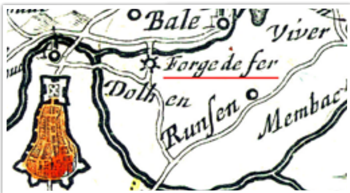
La Forge de fer figure sur une carte du duché de Limbourg, datée du XVII e siècle.