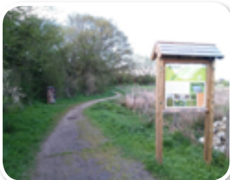
Groupe de travail sentiers et patrimoine