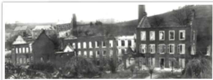
Filature et tissage Tiquet incendiés par les Allemands le 9 août 1914.

Puis il y a eu le moulin Al Berwette situé à la limite de Dolhain, qui a servi de foulerie, de moulin à grains et de moulin à l'huile. Depuis le XVII e siècle, Al Berwette a appartenu successivement, aux familles Melen, Le Ban, van der Heyden et Lemeunier. Il convient également de citer les importantes Filatures Tiquet-Levaux, incendiées la nuit du 9 au 10 août 1914.