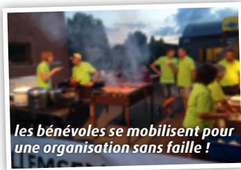
les bénévoles se mobilisent pour une organisation sans faille !

La sécurité n'est pas en reste : considéré comme un grand rassemblement à l'échelle de Baelen, le jogging est bien encadré et soumis à des exigences strictes : contrôle des entrées, poste de secours, signaleurs et mesures de prévention font l'objet de plusieurs réunions avec la commune