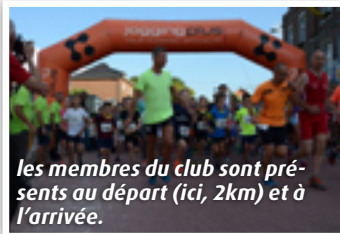
les membres du club sont présents au départ (ici, 2km) et à l'arrivée.

En tout, ce sont plus de 100 personnes qui travaillent au bon déroulement du jogging : installation des structures, signalisation, service bar, rangement et démontage, tous les membres du club, leur famille et de nombreux sympathisants y participent ! C'est ce grand nombre de bénévoles bien organisés qui permet d'accueillir les participants dans de bonnes conditions.