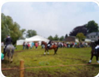
Associations en fête