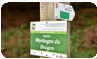
Groupe de travail nature